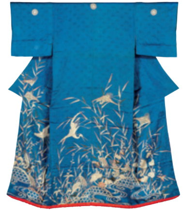
「納戸綸子地芦に鷺流水蛇籠文様小袖」