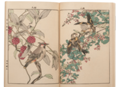
「景年花鳥画譜」今尾景年

細やかな観察と写生にもとづく花鳥画や、花や鳥をあらわした小袖、百花を描いた絵画からインスピレーションを受けて制作した着物などをご覧ください。花が咲き誇り愛らしい鳥が遊ぶ千總の庭にぜひ足を踏み入れてください。