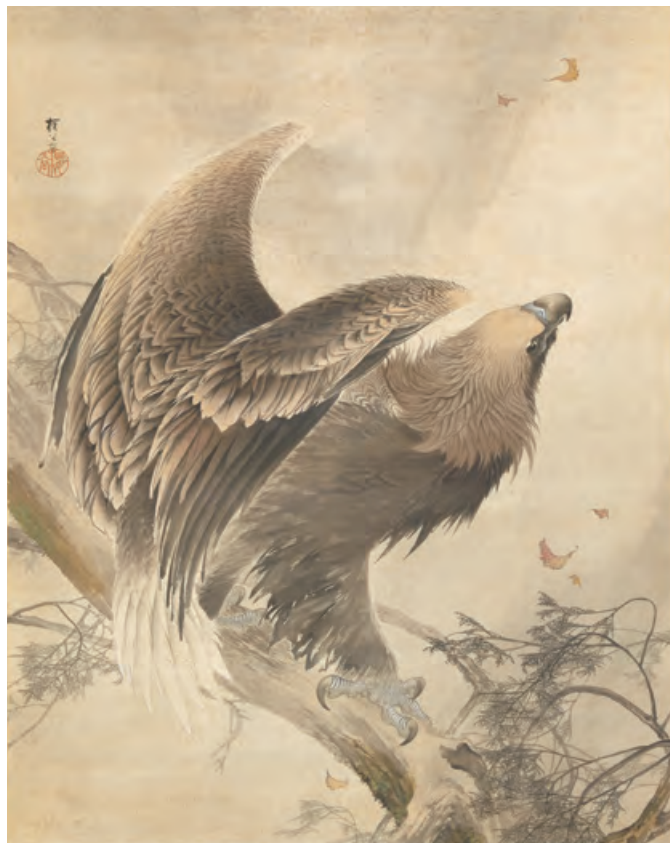
木島櫻谷「猛鷲図」 明治36年(1903)

絵画や工芸など作品の中には現実と異なる理 ことわり があります。それは現実の世界を描き出そうとする試みや鑑賞する環境からの影響、あるいは独特の美意識の表れなど、様々な背景のもと表現した結果です。本展では、あまり意識していなかったけど言われてみれば何故かは知らない、そんな表現の理由を屏風や小袖、掛軸などの千總の所蔵品を通して紐解きます。