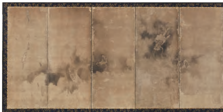
伝 狩野探幽「龍図」右隻 江戸時代