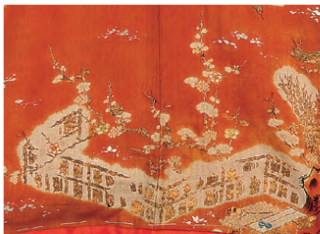
垣と雪持梅に文字文様小袖 江戸時代中期(18世紀中期 - 後期)