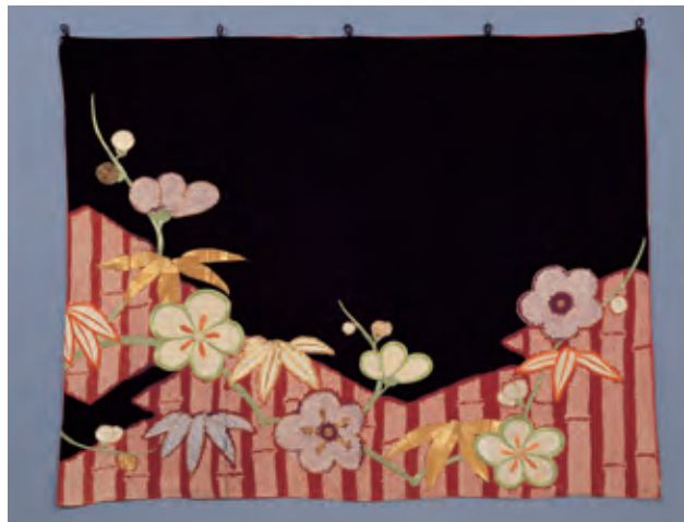
松皮取方に松竹梅裾模様(昭和時代初期)

This exhibition explores what the absence suggests us through seeing the elements not actually seen in these artworks.