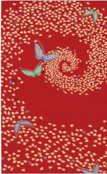
型友禪染裂 桜渦に蝶模様

何かを生み出そうとするとき、完成に至るまでの過程には多くの検討や変更があります。それはまるで行きつ戻りつ、ときには同じところで足踏みするような道のりです。