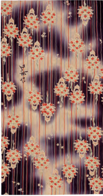
型友禪染裂 雲華し薬玉模様