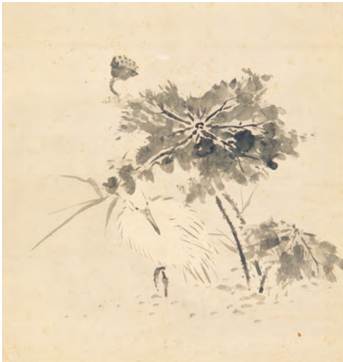
伝 今尾景年「蓮に鷺」明治時代